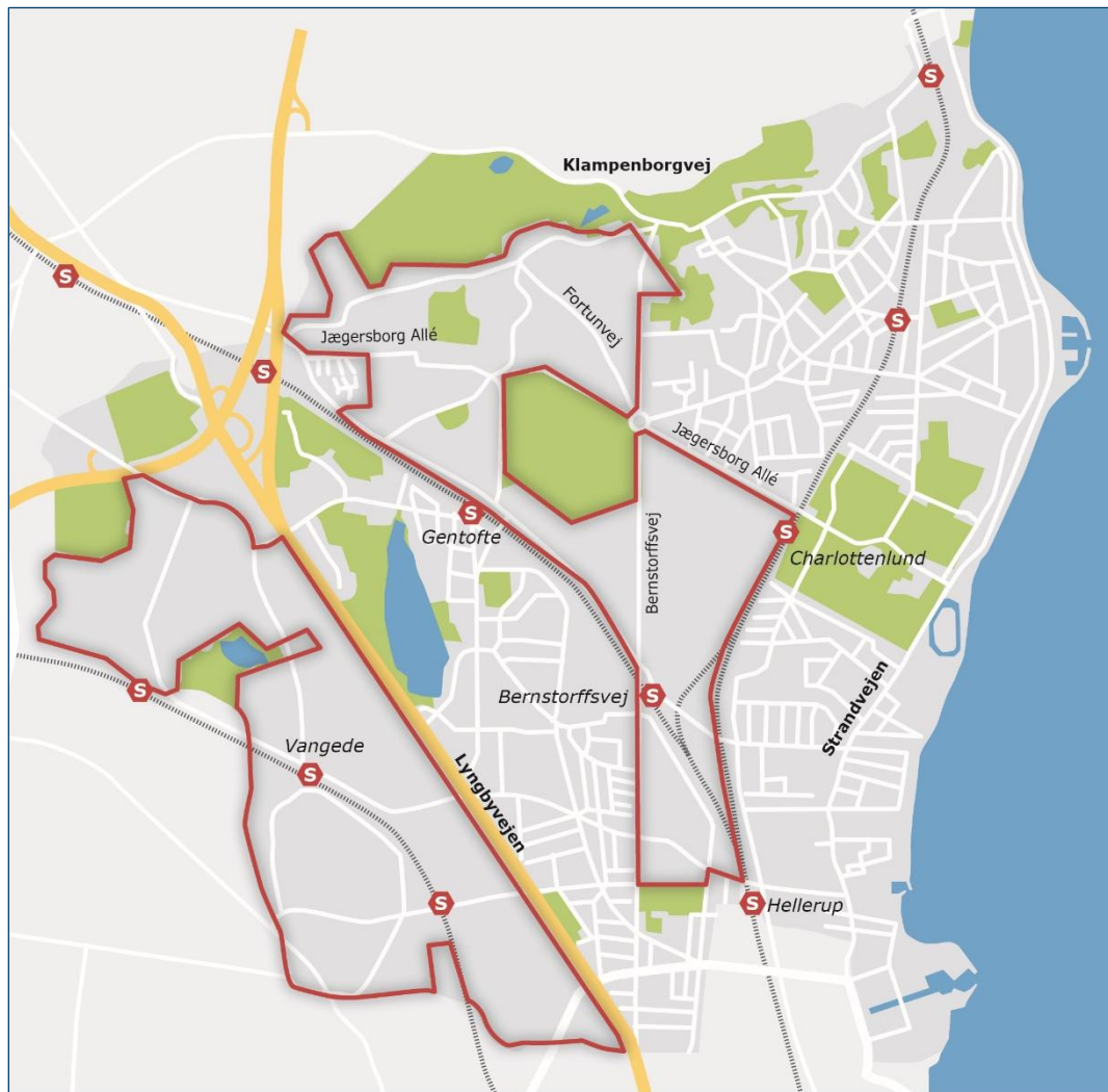
Områder MED fiber mulighed