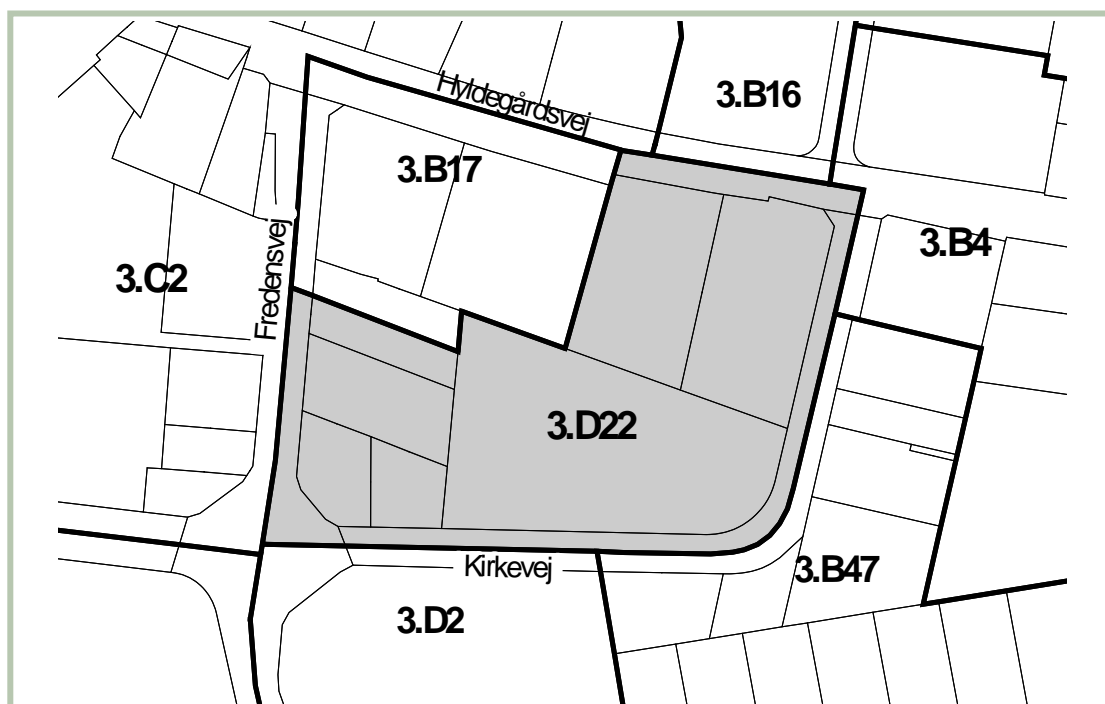
Kortbilag til kommuneplantillæg 15 til Kommuneplan 2009