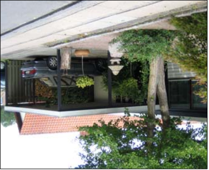
En carport tilpasset huset