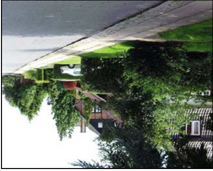
Vejblibedet kan sagtens være roligt og varieret på samme tid

Det er ikke nogen nem opgave, men ved velovervejet valg af hegn, planter og belægninger er det som regel muligt at anlægge en forhaver, som både er i harmoni med omgivelserne og som samtidig tilfredsstiller de øvrige krav til arealet.