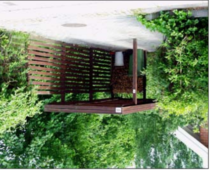
En carport tilpasset de grønne omgivelser