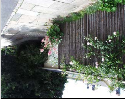
Planter gør faste hegn frodige og karakterfulde