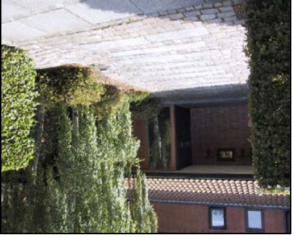
Belægning er ofte en væsentlig del af forhaveren