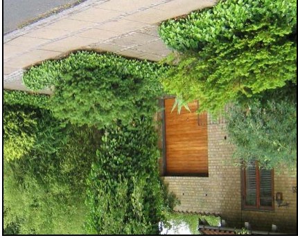
Planterne skal kunne trives, hvis det ønskede resultat skal opnås