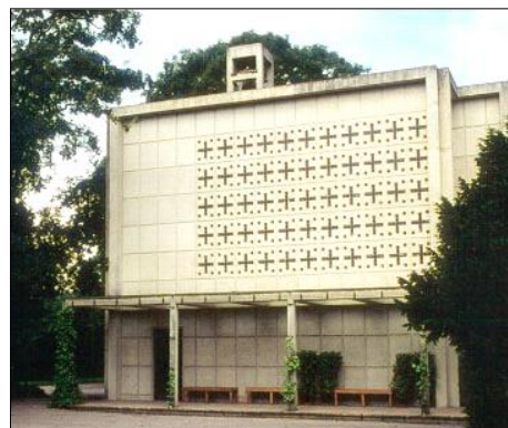
Schlegels Kapelbygning, 1936

Mariebjerg Kirkegård blev i 2006 udvalgt til den nationale kulturkanon for arkitektur på grund af dens enestående udformning.